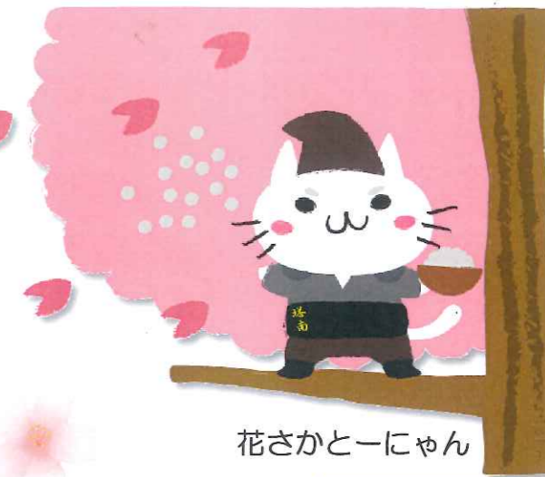
花さかとーにゃん

塔南の園設立20周年を祝って、誕生しました。 【名前】とーにゃん 【誕生日】12月2日(塔南の園 設立日) 【趣味】銭湯・温泉巡り(熱湯NG) 【口癖】「~だによ」 【好きな事】アリの観察、九条ネギの栽培